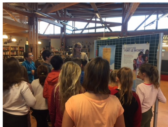
Visite de l'exposition du CDSI