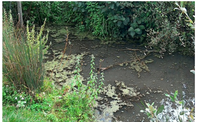
La réserve naturelle