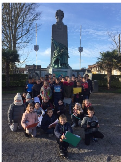
Sortie au monument aux morts le 11 novembre