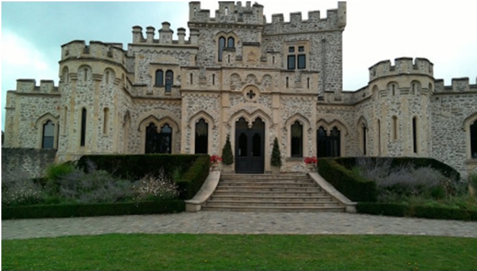
Le château d'Hardelot