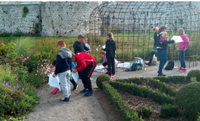
Les jardins Tudor