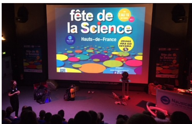
Fête de la science à Nausicaa

Ils participent également tous les mercredis à l'activité « tablettes » proposée par la médiathèque, et travaillent sur le thème du jardinage en lien avec les jardins ouvriers du quartier Henriville.