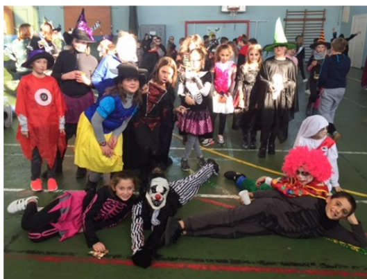
Le bal d'Halloween