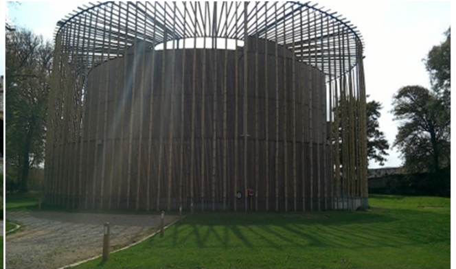
Le théâtre élisabéthain