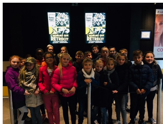
Ecole et Cinéma