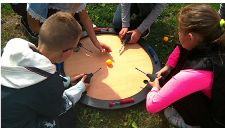
Les jeux anciens