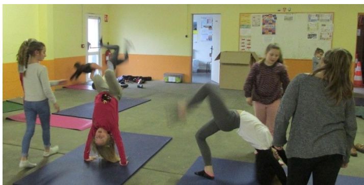
La zone aménagée pour la gym