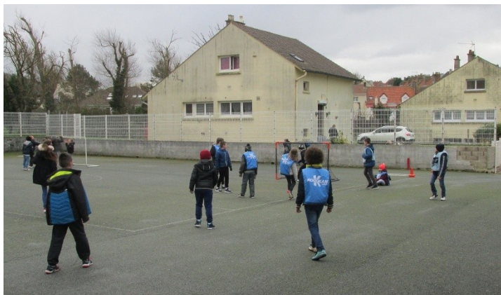
La zone de foot dans la cour