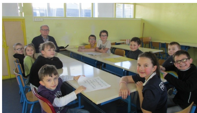
Le conseil des délégués de cycle 2