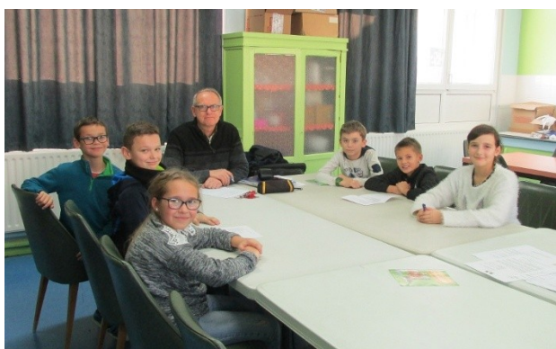
Le conseil des délégués de cycle 3

3- Réunion des délégués de classe (cycle 3 puis cycle 2) pour synthétiser les propositions et les demandes.