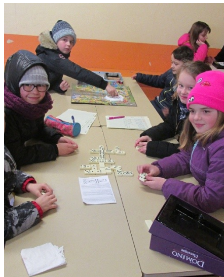
Les jeux de société dans le préau