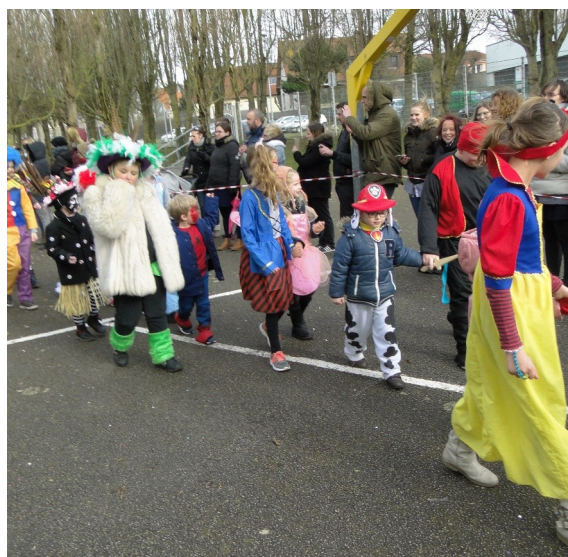
Carnaval à La Fontaine, Curie et Vallois

Les CM lisent des histoires de carnaval aux élèves de Maternelle.