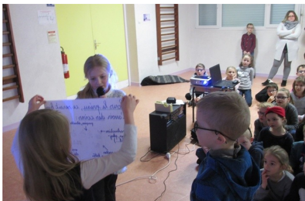
Assemblée plénière cycle 2