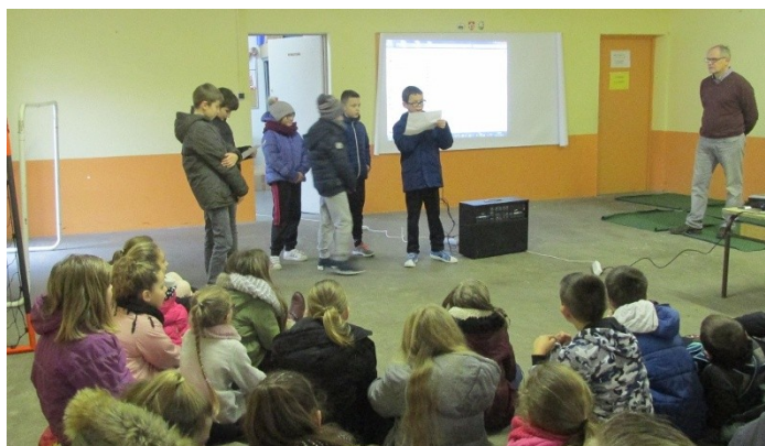
Assemblée plénière cycle 3