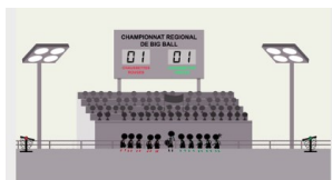
Tous différents, tous égaux (épisode 1/5)

Une nouvelle vidéo pour travailler « respecter autrui » en cycle 3 « le racisme, c'est pas du sport » LIEN