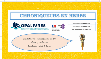
document de présentation

Vous avez encore deux semaines pour vous inscrire au concours «chroniqueurs en herbe» (jusqu'au 21 octobre)